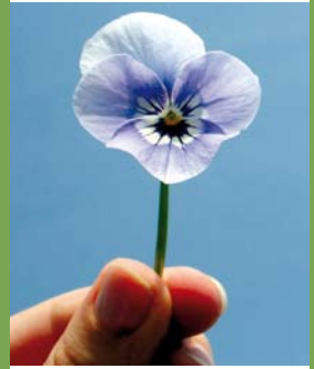
MAAK UW TUIN LENTEKLAR