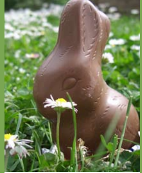
TIPS VOOR EEN VROLIJK PASEN